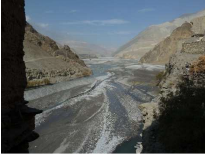
Kali Gandaki (Tal der Winde)