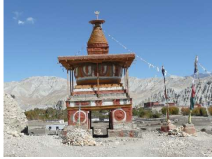
Stupa in Tsarang